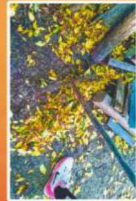
Mulți copaci sunt la Tanti Valina în gospodărie, adunatul lor necesită ca săptămânal să intrăm pentru a face curățenie.

La curățat porumb. Porumbul - recoltă de toamnă Porumbul - avuția sîtenilor.