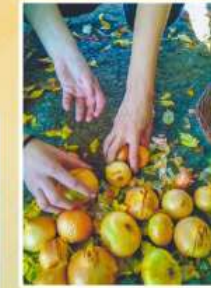
Iilca, Sabina, Victor la curățit ceapă!!! Ce poate fi mai plăcut decît să vezi ca cineva mai trista ca tine se Bucură?!