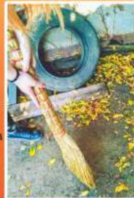
Adunatul frunzelor de toamnă! Toamna - anotimpul cu cel mai original Colorit.

La curățat porumb. Porumbul - recoltă de toamnă Porumbul - avuția sîtenilor.