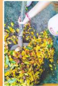
Copii adună cu plăcere frunzele și le deposedează într-un loc anume, știind că nu au voie să le dea foc!